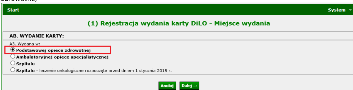
Rysunek 2 Przykładowe okno (1) Rejestracji wydania karty DiLO – Miejsce wydania w POZ

W przypadku wydawania karty DiLO w POZ należy zaznaczyć opcję: Wydana w : Podstawowej opiece zdrowotnej