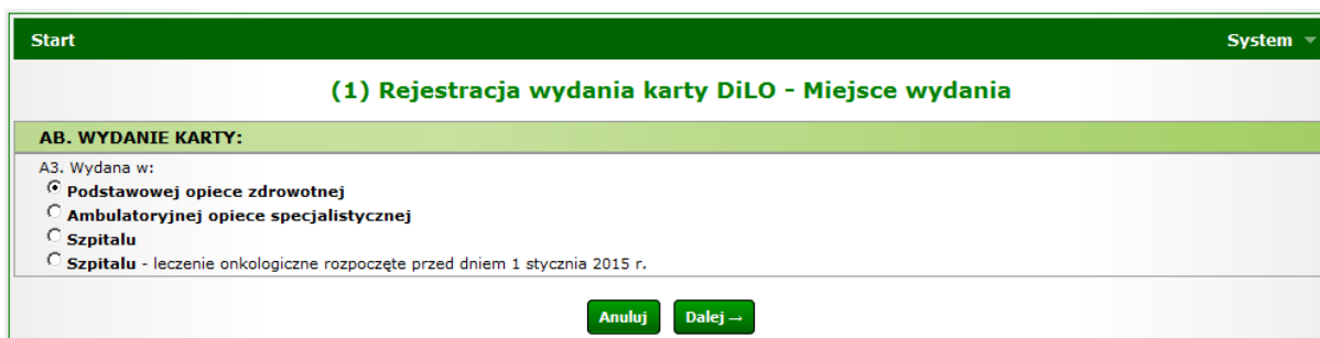
Rysunek 1 Przykładowe okno (1) Rejestracji wydania karty DiLO – Miejsce wydania

Jako pierwsze wyświetlone zostanie okno (1) Rejestracja wydania karty DiLO – Miejsce wydania.